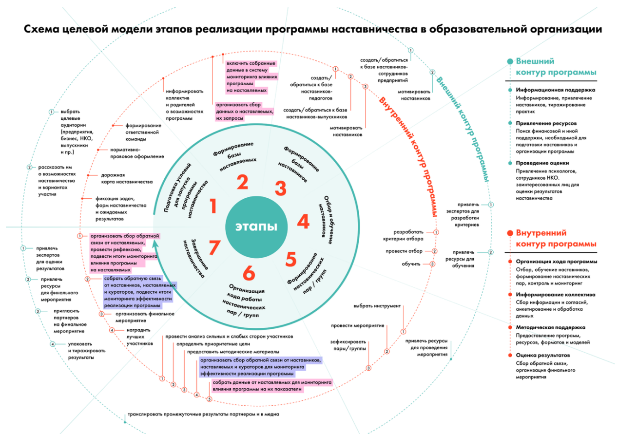
Рис. 1. Схема целевой модели этапов реализации программы в образовательной организации

Содержание каждого этапа, представленное в виде направлений работы с внутренним и внешним контурами, содержится в таблице 1 «Целевая модель этапов реализации программы наставничества в образовательной организации».