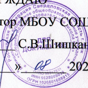
График организации питания МБОУ СОШ №3